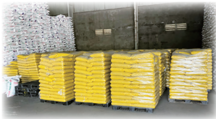
ベトナムへ輸出された当社鶏糞肥料

鶏卵の輸出に関しましても継続して取り組んでおり、海外向けビジネスを着実に進めてまいります。