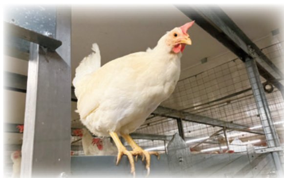
エイビアリー鶏舎の頑強な採卵鶏

家庭用として一定の認知を受けるまでになりましたが、今後は業務用や加工用、輸出も視野に入れてまいります。