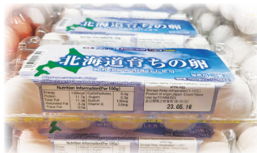
香港の店頭に並べられた当社製品